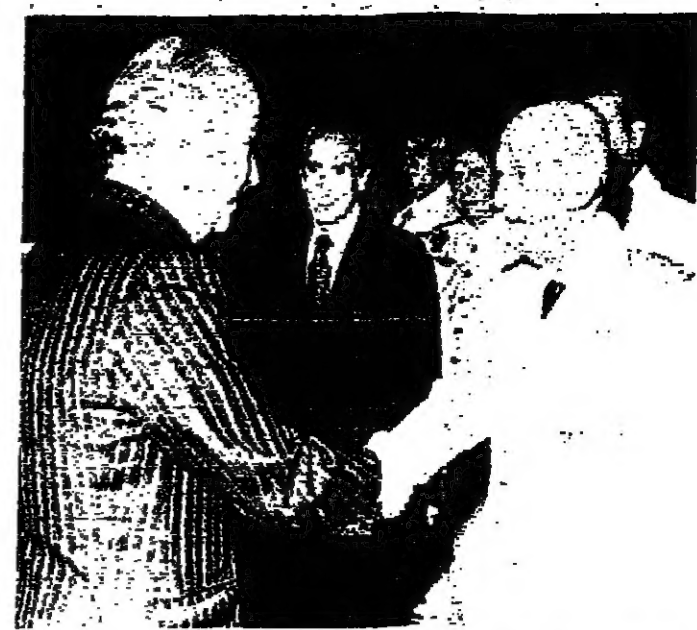
الرئيس الاسباني فرانكو يستقبل السيد اسماعيل فهمي في مدريد